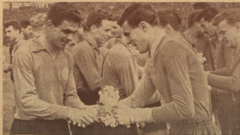
Преди другарската среща в София футболистите на ЦДНА и БСК си разменят цвета.

В изминалите досега години, футболният отбор на ЦДНА е изиграл общо 40 международни състезания. Разпределени по страни, те са отразени твърде нагледно в следната таблица: