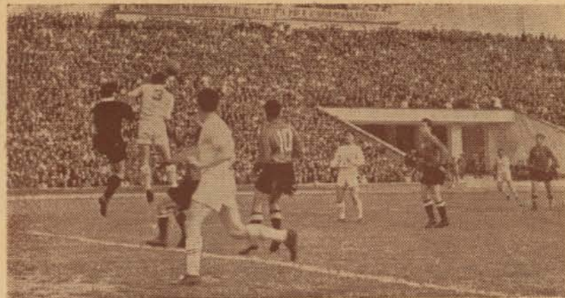
Момент от миналогодишната среща между отборите на „Динамо“ (Букурещ) и ЦДНА, състояла се в София.

„Динамо“ — Букурещ е специалист за успешно представяне в международни изпитания. Показатели за възможностите и класата на отбора са резултатите от международните срещи, които той е играл през последните години. Ето някои от тях: с „Динамо“ — Тбилиси в Букурещ 2:1; с „Дожа“ — Будапеща в Букурещ 3:1; с ЦДНА в София 3:2; с ФК „Лижеж“ в Лижеж 2:1; с „Лутън таун“ от Англия в Букурещ 1:2; с „Даринг клуб“ в Брюксел 4:1 и др. Като участник във втория турнир на европейските клубове-шампиони отборът на „Динамо“ се срещна на свой терен с първенца на Турция — „Галата сарай“ и го победи с 3:1. На второто състезание в Истанбул победител бе „Галата сарай“ с 2:1. С общ резултат 4:3 футболните на „Динамо“ — Букурещ се класираха за осмината финал от турнира.