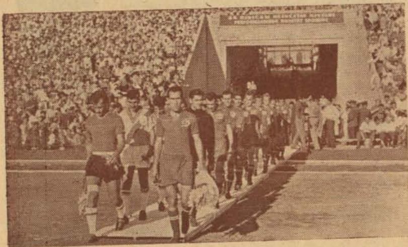
Отборите на „Галата Сарай“ и „Динамо“ излизат на Букурещкия стадион

Тази година „Динамо“ — Букурещ прекара част от подготовителния си период в съвместни тренировки със софийския „Спартак“.